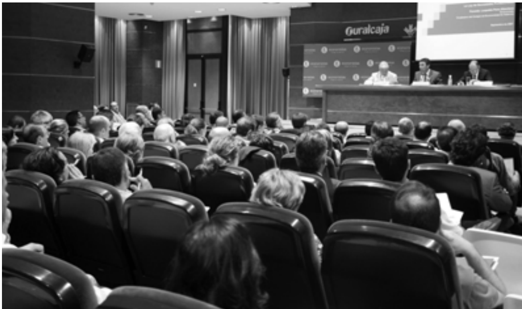
Más de 200 economistas llenaron por completo el salón de actos de Ruralcaja, lugar donde se celebró el evento.

La conferencia terminó con dos cuestiones que pueden parecer antitéticas, la obligatoriedad de las SP, donde dejó claro que las SP son de obligado cumplimiento y no de libre elección para quienes reúnan las condiciones que allí se proponen, y la reserva de actividad. Sobre esta última cuestión manifestó que las SP son precisamente el colofón de esta nueva regulación. La reserva de actividad profesional no busca un privilegio en el sentido de ventaja comparativa injustificada, sino precisamente identificar los mercados sobre los que nos movemos y dada la dificultad de conocer a priori las prestaciones de servicios, cantidad y calidad, sólo la tal reserva de actividad protege al ciudadano y al profesional en una misma institución. ●