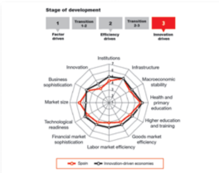
Fuente: The Global Competitiveness Report 2009-2010

En cuanto al diagnóstico de situación, el recientemente publicado informe DAVOS, basado en un índice de competencia global que compara a 133 países en los denominados 12 pilares de referencia, tiene evidente interés. La idea del trabajo, independientemente de las debilidades de toda encuesta, resulta enormemente ilustrativa y sus resultados, respecto a la economía española, aún más cuando se tienen en cuenta los datos del índice 2009-2010 respecto a los que se obtenían en el 2008-2009.