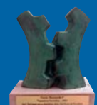
Premio "Economía 3" - 2007 Mejor Trayectoria Formativa