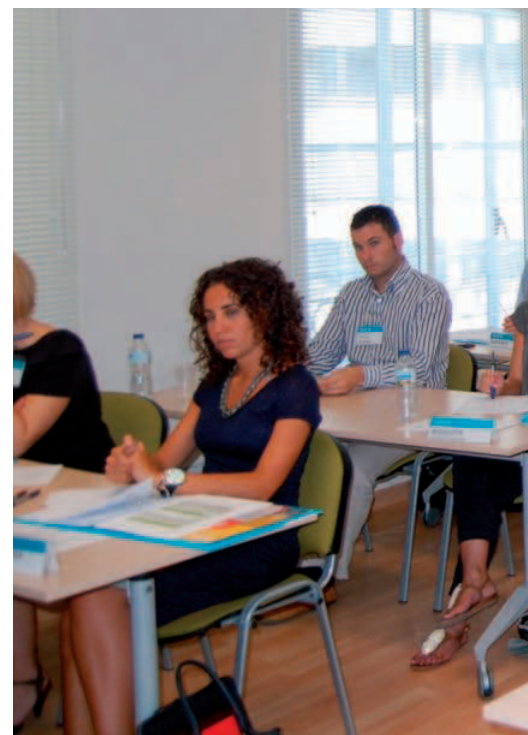
▲ Clases en las aulas de EDEM

Se exige a los alumnos la presentación y superación del examen oficial BEC (Business English Certificate) del Cambridge ESOL, equivalente al nivel C1 (Superior) del Marco Común Europeo de Referencia para las Lenguas, focalizado en inglés económico y de negocios. Para ello se les prepara con clases durante el programa teórico-práctico, así como durante varios sábados por la mañana entre los meses de marzo a junio.