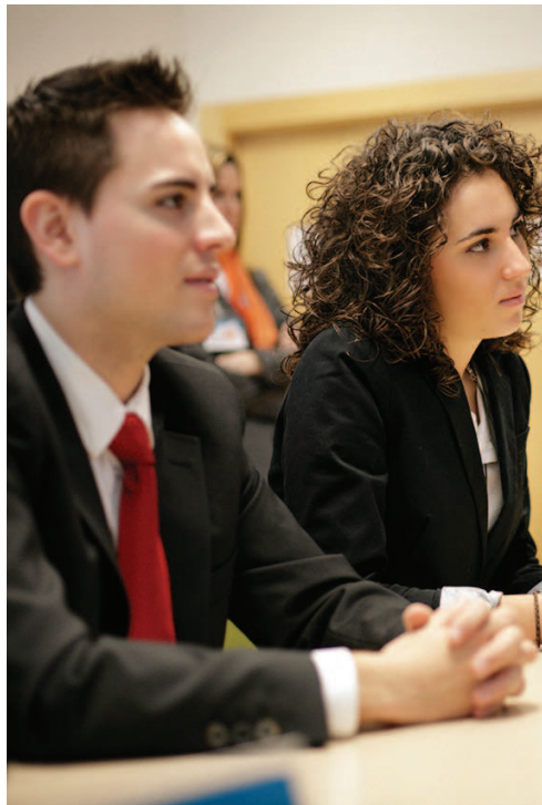
▲ Alumnos del MBA en clase