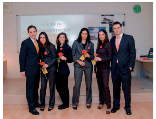
▲ El equipo ganador del Bussines Game L'Oréal