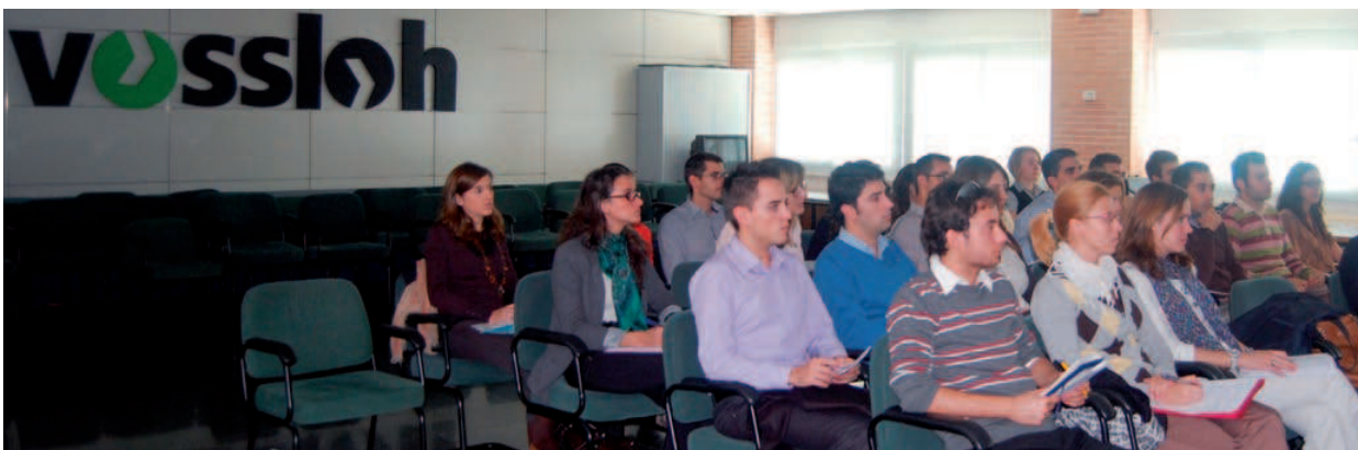
▲ Clase práctica del módulo de Sistemas de Información, en las instalaciones de Vossloh

En función de su formación y con el fin de homogeneizar niveles, EDEM entregará a los alumnos, previo al inicio del curso, material para preparar y trabajar. Durante la primera quincena de septiembre se realizará un examen de inglés para confirmar el nivel de los alumnos.