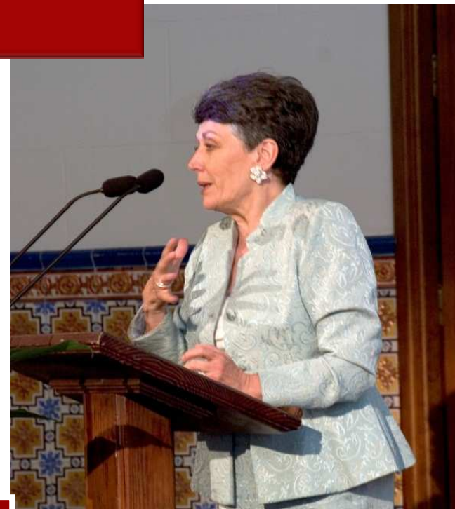
Rosa María Mateo, periodista.