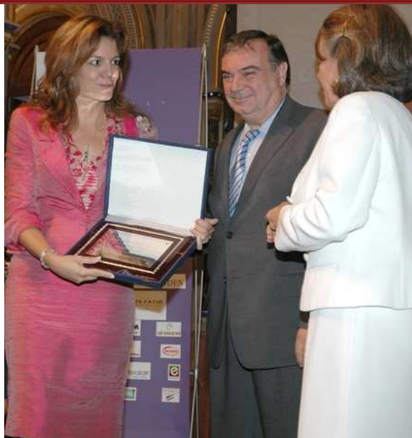
Amparo Moraleta, Presidenta de IBM de España, Portugal, Grecia, Israel y Turquía.