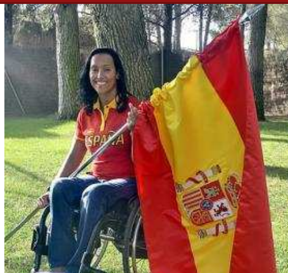
Teresa Perales, deportista con más medallas en la historia de los Juegos Paralímpicos.