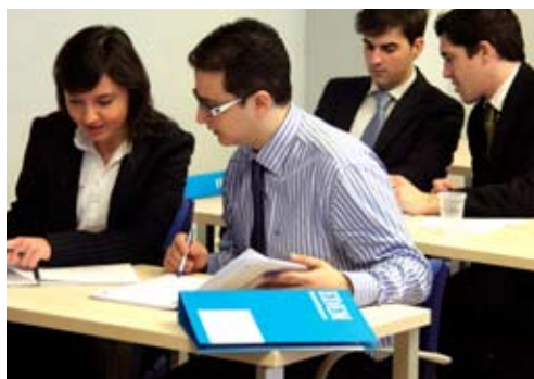
▲ Trabajos en grupo