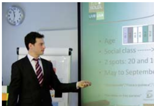
▲▲ Sesiones de exposición