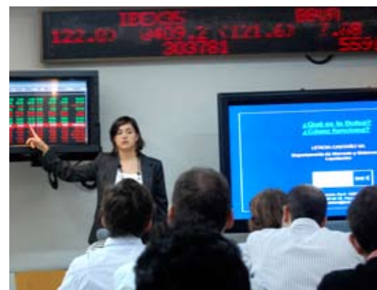
▲ Clase en la Bolsa de Valencia