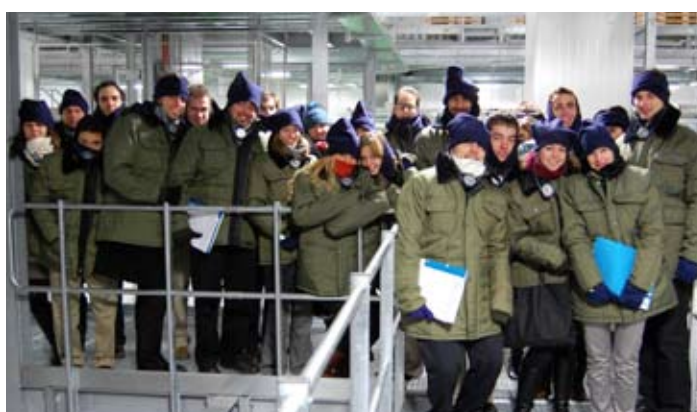
▲ Visita al Almacén Siglo XXI de Mercadona