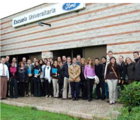
▲ Visita a las instalaciones de la factoría Ford