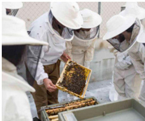
Visita a las instalaciones de Apisol.

Complementar con determinadas habilidades personales y relacionales los conocimientos adquiridos durante el curso es una parte esencial de la formación de los alumnos. Es por ello que se trabajan los estilos de comunicación, trabajo en equipo, presentaciones en público y negociación, entre otras.