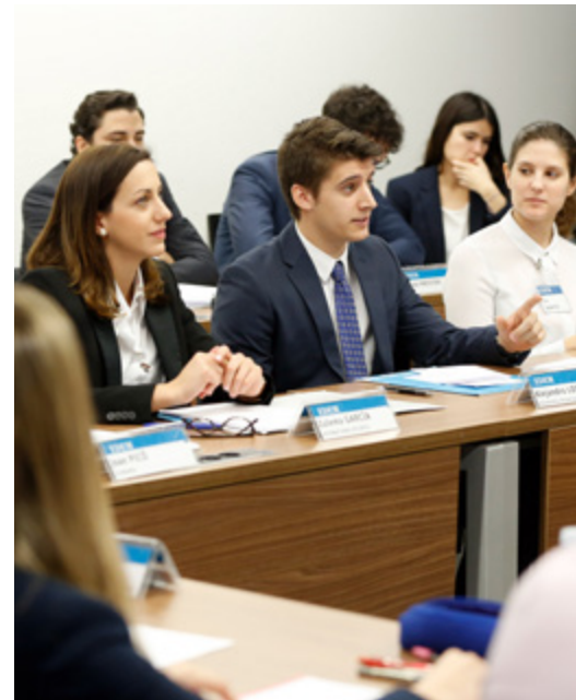
Alumnos durante una sesión.

• Curso presencial, con dedicación exclusiva a full-time . • Duración: 1.868,5 horas (74,74 créditos ECTS) , distribuidas en tres bloques: Módulo 1: Conocer. Programa teórico-práctico del 13 de septiembre de 2016 a finales de febrero de 2017: 1.078,5 horas (540,5 presenciales y 538 no presenciales) de lunes a viernes de 9:00h a 14:00h y casi todas las tardes de 16:00h a 18:30h en nuestras nuevas instalaciones de la Marina Real Juan Carlos I. Las tardes en las que no haya clases presenciales, se emplearán para la preparación de trabajos, realización de ejercicios e informes, asistencia a tutorías, seminarios y otras actividades. Módulo 2: Aplicar. Conocer y vivir la empresa por dentro (prácticas) de marzo a julio de 2017: 640 horas de prácticas no remuneradas en las empresas becantes o en los centros que estas determinen. Dedicación de 40 horas semanales, en el horario establecido por las empresas. Módulo 3: Relacionar. Trabajo Fin de Máster de marzo a julio de 2017: 150 horas y de manera paralela a la realización de las prácticas en las empresas. • Será necesario superar estos tres módulos (tanto a nivel académico como de competencias y habilidades) para obtener el título del MBA.