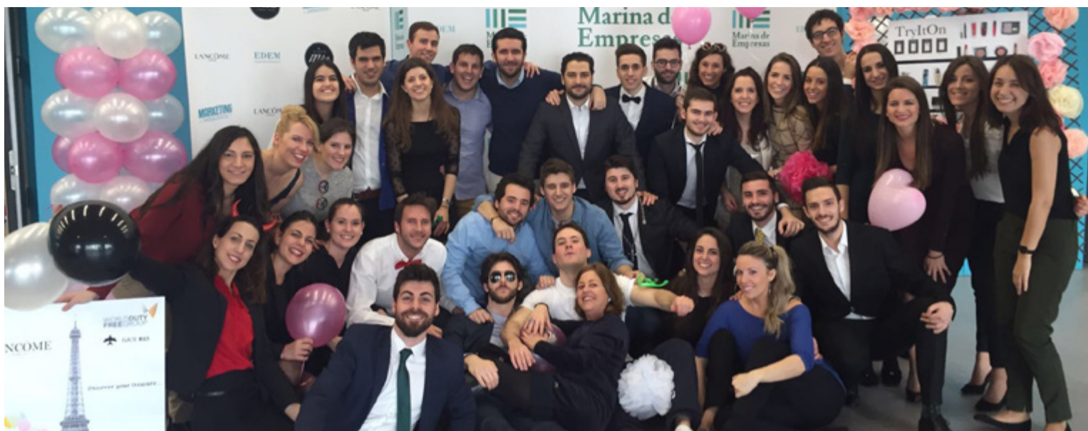
Alumnos de la 10ª edición tras la presentación final de sus trabajos de marketing.

Licenciada en ADE-Derecho y alumna de la 10ª edición del MBA Junior EDEM