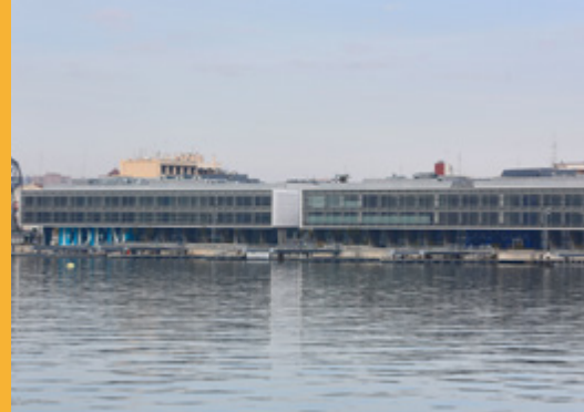
Instalaciones de EDEM ubicadas en Marina de Empresas.

• Asociación de Antiguos Alumnos. A la finalización del MBA, y una vez se haya cumplido el compromiso de inserción en las empresas becantes, los alumnos tendrán la oportunidad de formar parte de la Asociación de Antiguos Alumnos de EDEM, formada por empresarios, directivos y profesionales que han pasado por las aulas de EDEM.