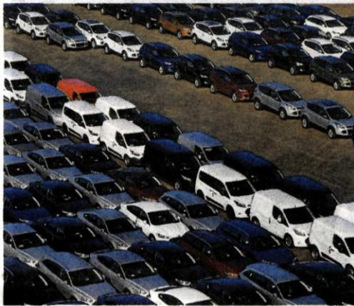
Coches producidos en Almussafes en el puerto de Sagunto. ■■

La decisión supone un cambio radical tanto en la política de la factoría de Ford como en el tráfico que albergará Sagunto. La planta de Almussafes había rehusado este puerto optando por el de Valencia ya que se encuentra más cerca de sus instalaciones. La asunción de los costes adicionales llega cuando Noatum ha ofrecido a la factoría las ru-