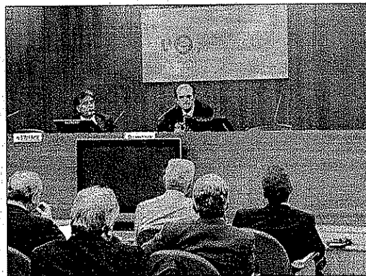
Asistentes a la conferencia organizada por el Ivefa en Valencia.

«respuestas inteligentes con rapidez». La gestión del talento divide a las pymes con futuro y a las que no lo tienen. El experto se mostró partidario de buscar el talento «dentro de la cantera», pero en el caso de que no existiera, «habrá que buscarlo fuera de la familia empresarial». En su intervención, el profesor del IESE destacó la importancia de la disciplina en el «buen líder», entre otros valores y actitudes como el optimismo, la paciencia y la «humildad para reconocer y enmendar los errores cometidos».