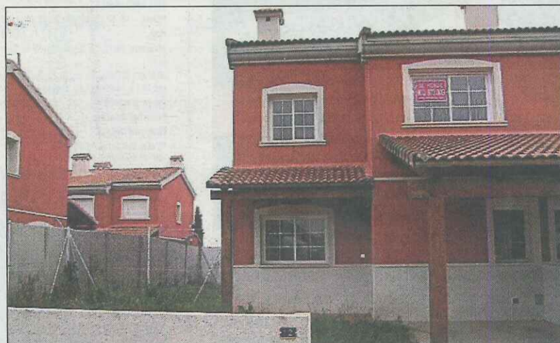
Vivienda a la venta en la Poble de Vallbona por 150.000 euros.

Los inmuebles se encuentran situados, en su mayoría, en la zona urbana. Los precios de las casas os-