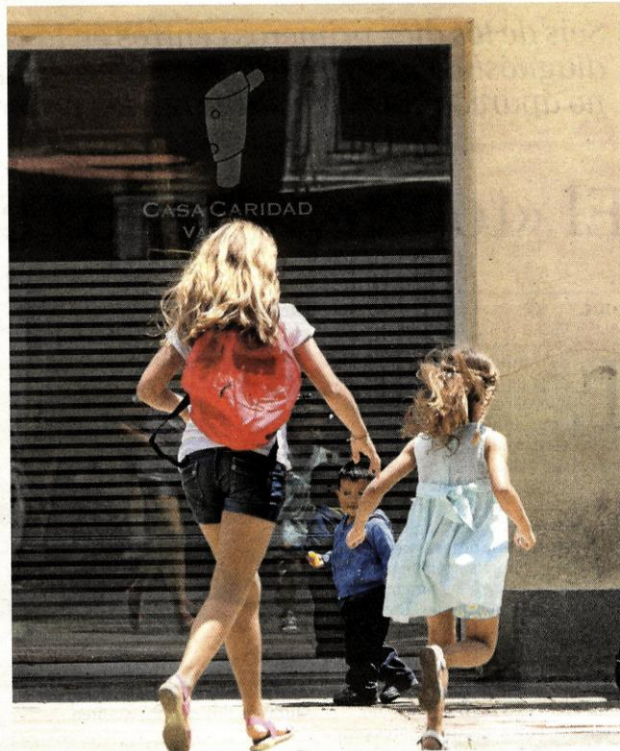
Dos menores se dirigen a un comedor social de Valencia